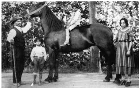
Pierre Stangus en Catharina Caja Miroesch met twee zonen.

De directeur-generaal van politie in Nijmegen stuurde op 14 mei een geheim bericht naar de vijf grote steden, een dag later gevolgd door een telegram met de mededeling om alle in uw gebied verblijvende zigeuners, ook kinderen aan te houden en deze naar kamp Westerbork over te brengen.