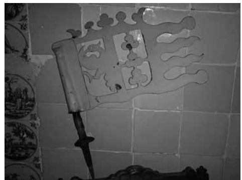
Een windvaan van de Tjessens-state, met het familiewapen

Voor de rechter ontvouwde Hiddema een plan om de terp met dertig centimeter op te hogen. Op die manier zou de ploeg de archeologische sporen sparen. De rechter besliste in het voordeel van de Rijksdienst, maar de rechtszaak was voor de dienst wel een aanleiding om het voorstel van de boer serieus in overweging te nemen. En zo startte een uniek experiment. Na amper intern beraad verleende de dienst aan