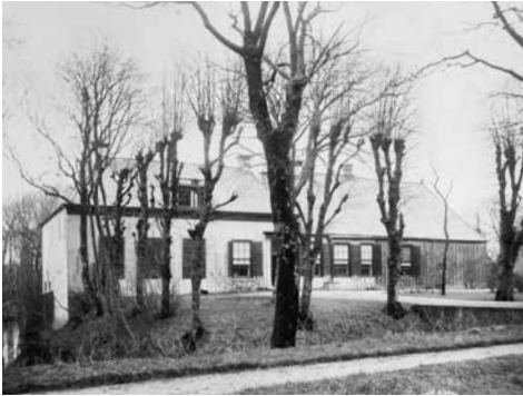
De state Tjessens in 1896, vlak voor het huis afgebroken werd