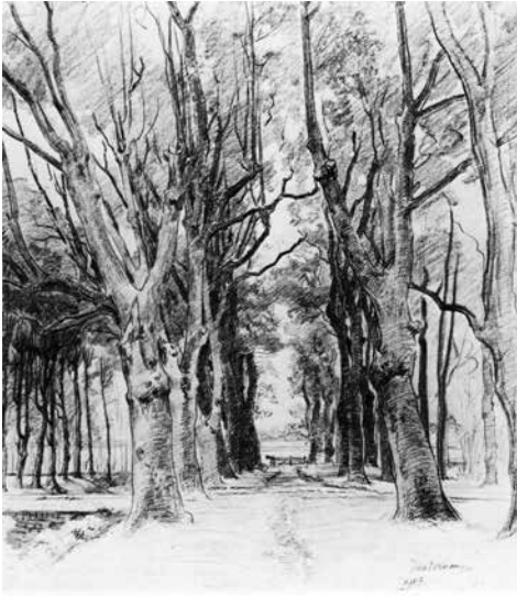
In 1907 was het park op de terp nog niet verduwenen